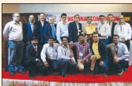
First Prize for Excellence in Suggestion Scheme (Group : Fertilizer Industry)