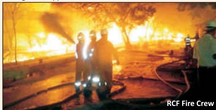
RCF Fire Crew

The fire was of large magnitude and RCF team participating in such incident will boost confidence in handling such situation in future. Firefighting along with MARG members for such a long duration is a new experience. Working of our emergency equipment to help our MARG partners has brought recognition of our emergency equipment maintenance practice. Young team members of RCF was excited to gain this experience. Top management appreciated Fire Crew's efforts.