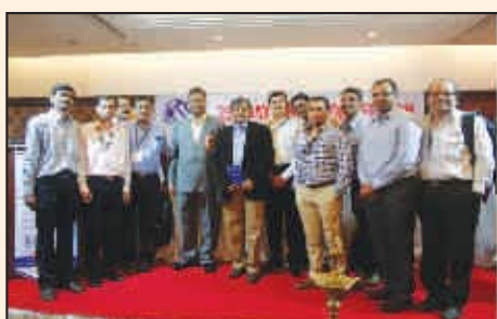
RCF Tromby Unit Facilitated by INSSAN for 25 years in Suggestion Scheme